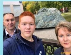
Roderick Impey Murchison