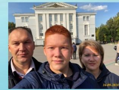
Пермский театр оперы и балета им. П.Чайковского С.Прокофьев «Ромео и Джульетта»